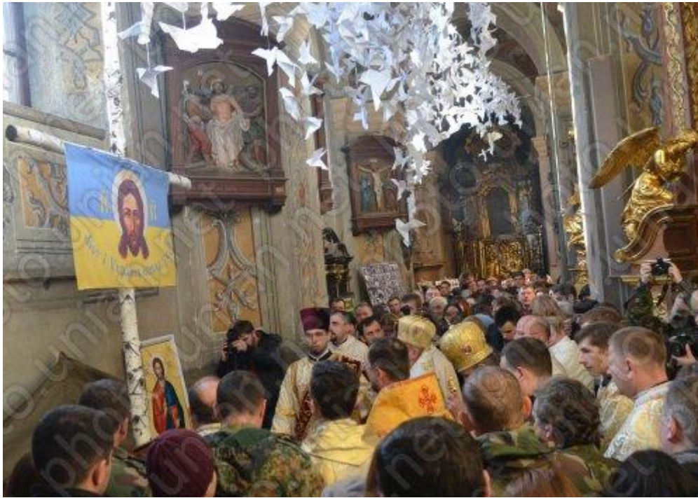
In the temple, Peter and Paul in Lviv, placed a cross that survived the shelling in the area of ATO